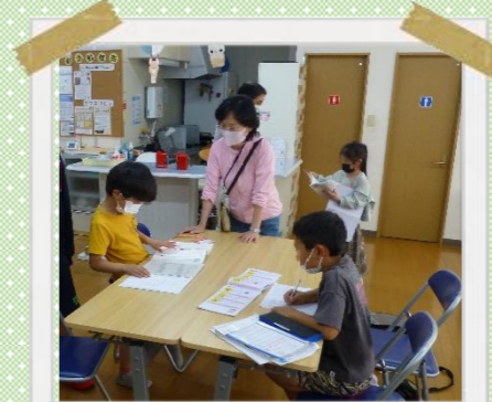
みんな de お勉強