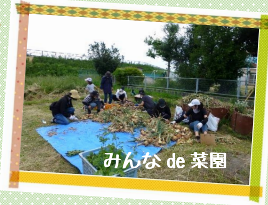
みんな de 菜園